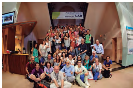
Imatge d'un dels grups de treball.

L'ambient, a totes les sessions, va ser molt actiu i interactiu, fet que va ser molt ben valorat tant per part