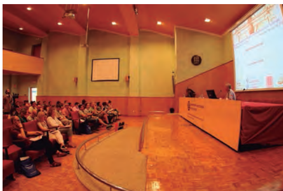
Un moment de la conferència inaugural.

Aquesta jornada va ser organitzada per la nostra entitat, juntament amb membres de la darrera junta de l'Associació del Professorat de Tecnologia de Catalunya (APTC) i membres del Centre Específic de Suport a la Recerca i la Innovació Aula de Recursos de Tecnologia (CESIRE AULATEC), amb la col·laboració de l'ESEIAAT, que van cedir els seus espais per a la celebració de la jornada.